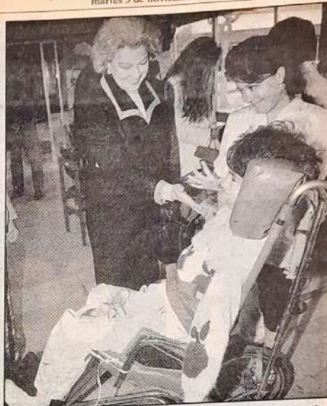
La gran actriz Malú Gatica llegó también a saludar a los niños de la Teletón.

Margot Kahl comparte alegremente con una de las pequeñas del instituto de rehabilitación.